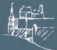
Muzeum Warmii i Mazur w Olsztynie