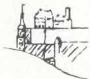
Muzeum Warmii i Mazur w Olsztynie