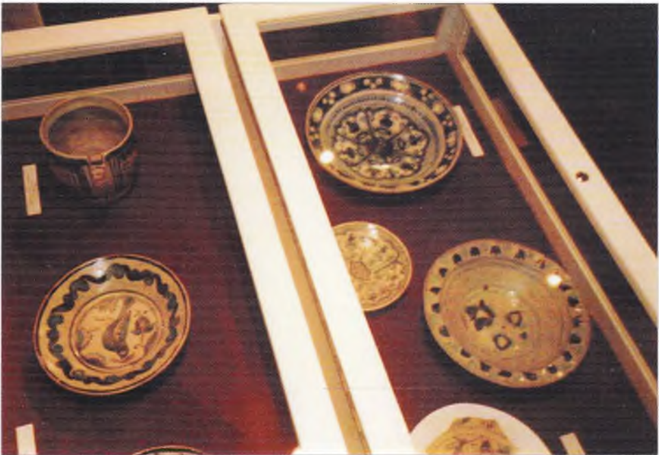
6. Talerze wydobyte podczas wykopalsk prowadzonych przez Adama Mackiewicza na terenie nieistniejącego ostródzkiego ratusza – zbiory Muzeum w Ostródzie.