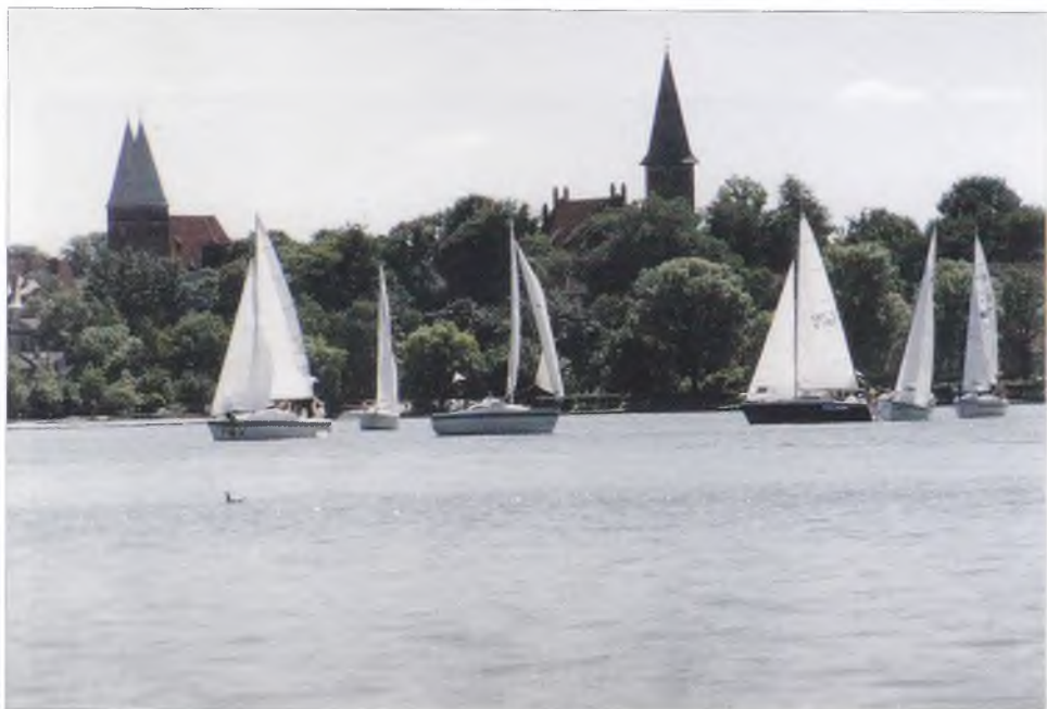
8. Jezioro Drwęckie z neogotyckimi ostródkimi kościołami w tle.