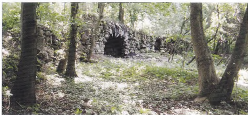
9. Grota z dylewskiego parku Franza von Rose.