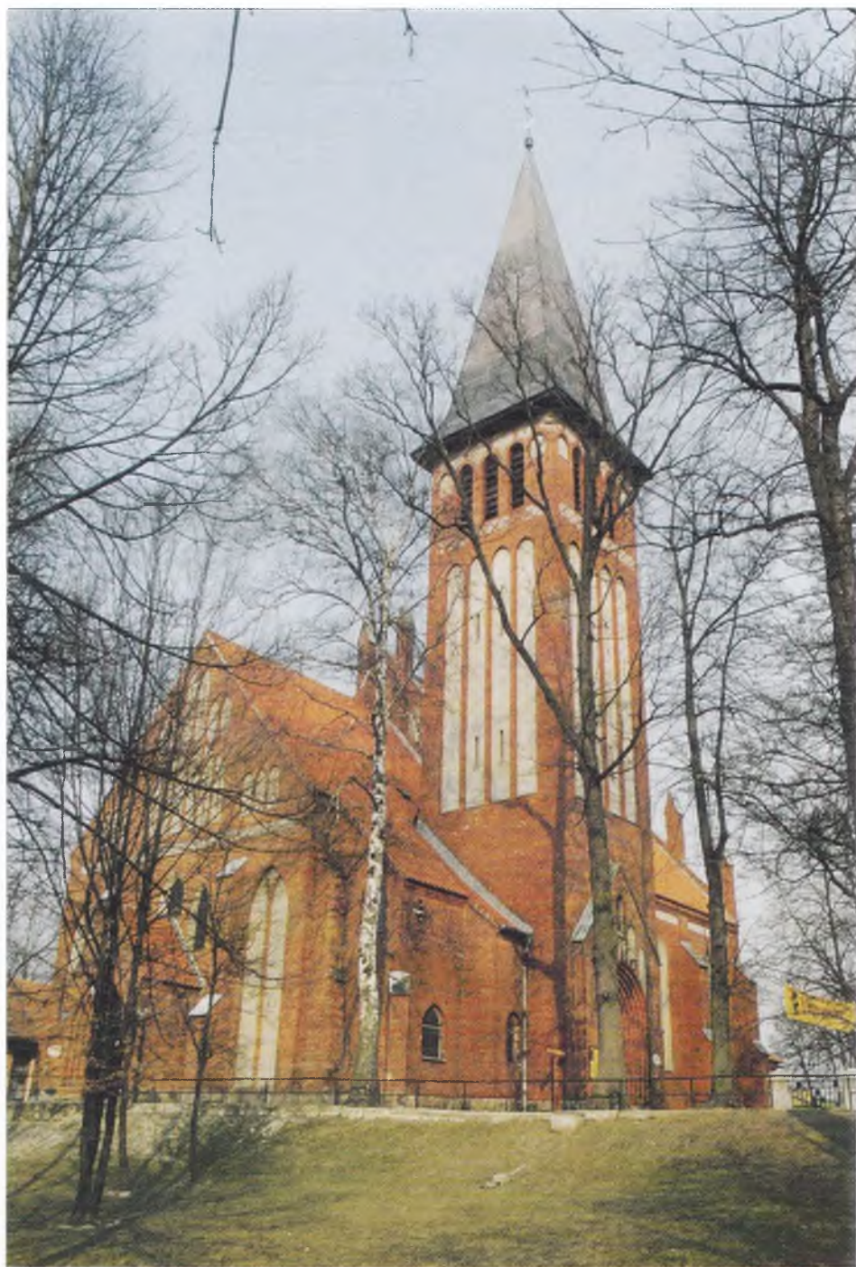
7. Kościół Niepokalanego Poczęcia Najświętszej Marii Panny w Ostródzie.