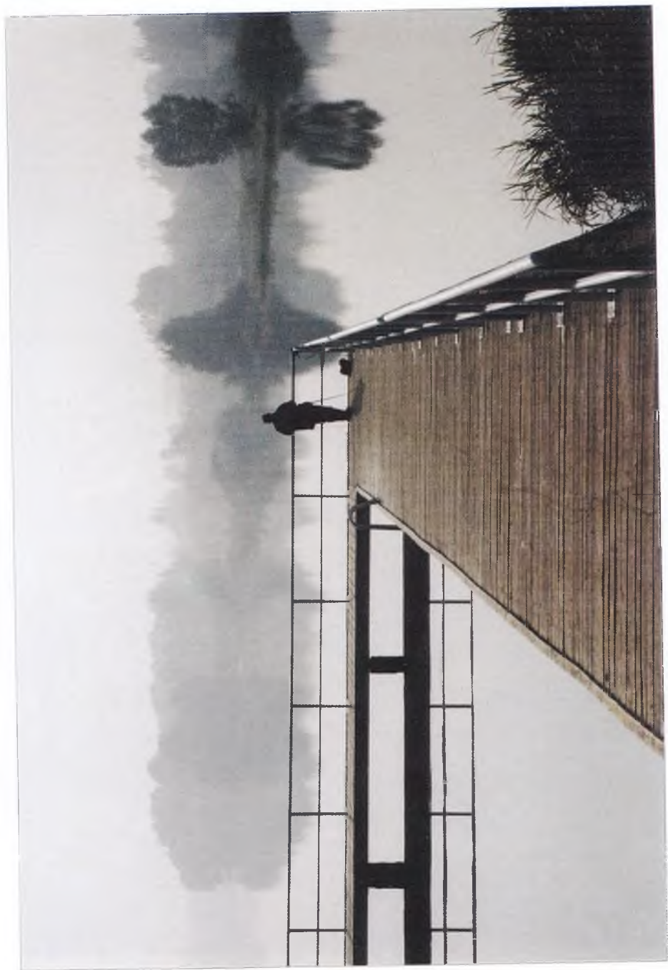
10. W cisy letniego poranka.