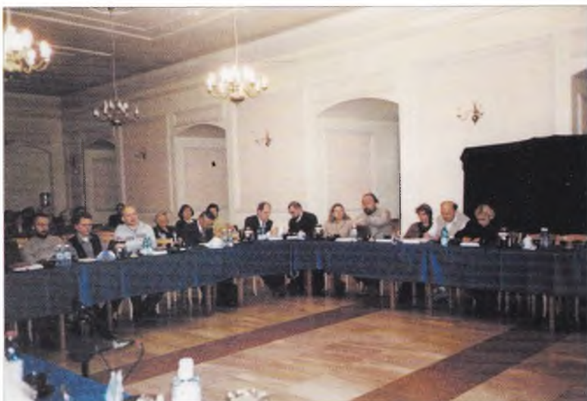
3. Kolejny dzień obrad ośrodkowej konferencji.