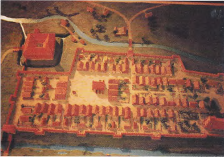
5. Próba rekonstrukcji kształtu urbanistycznego Ostródy w końcu XVI wieku (makiętę wykonał Jan Dybowski) – ekspozycja stała Muzeum w Ostródzie.