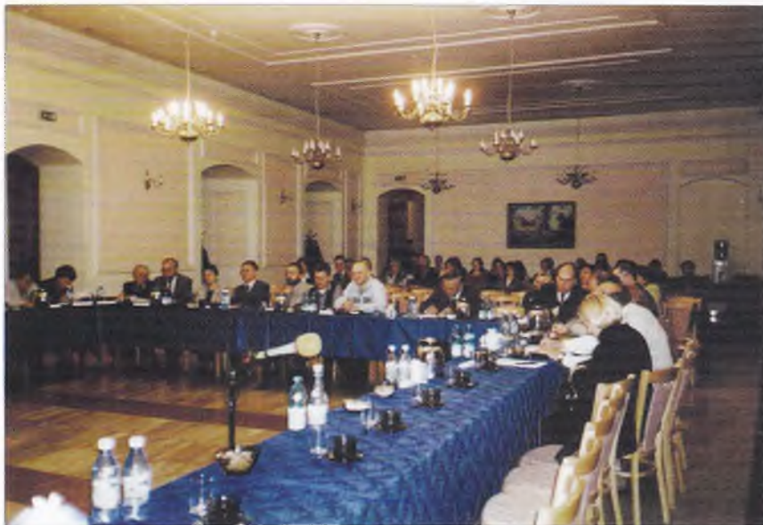
1. Obrady konferencji „Religia i polityka w świecie antycznym” w sali reprezentacyjnej ostródzkiego zamku.